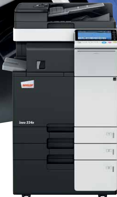
ineo 224e s uvlakačem originala (DF-624), unutarnjim finišerom (FS-533) i postoljem velikog kapaciteta (PC-410)