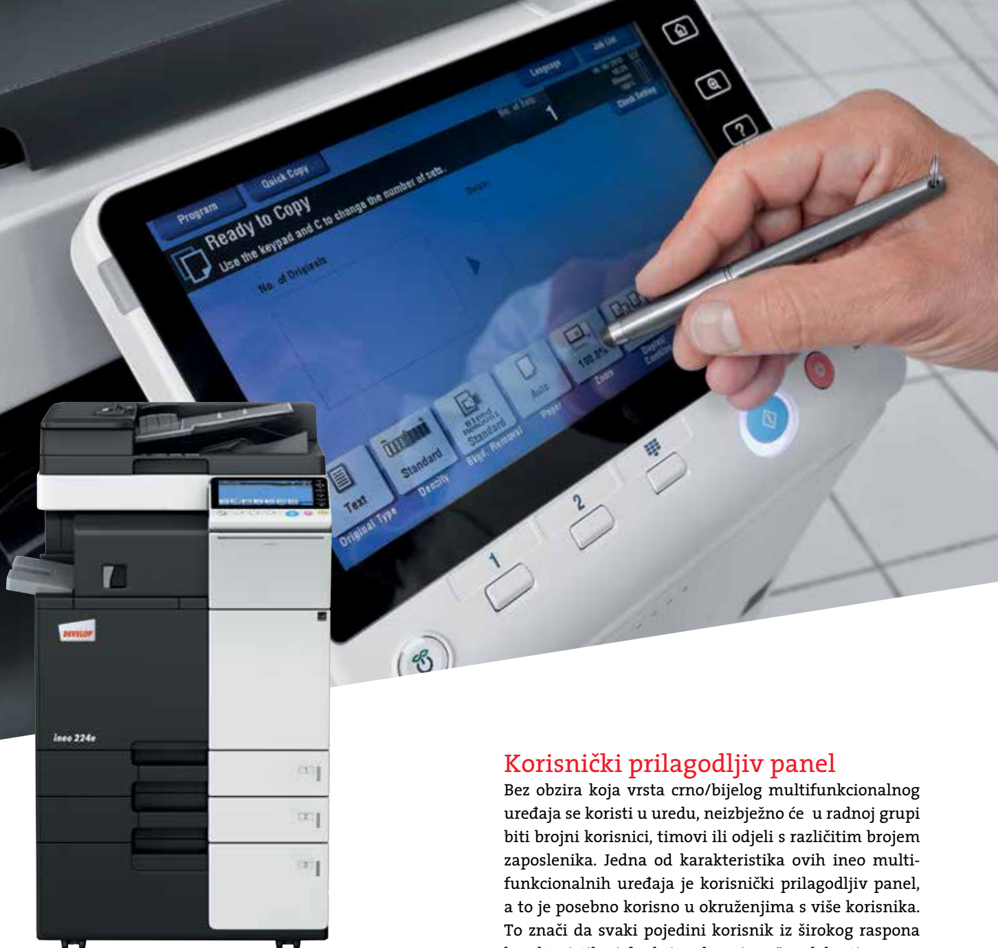
ineo 284e s uvlakačem originala (DF-624), unutarnjim finišerom (FS-533) i postoljem velikog kapaciteta (PC-410)